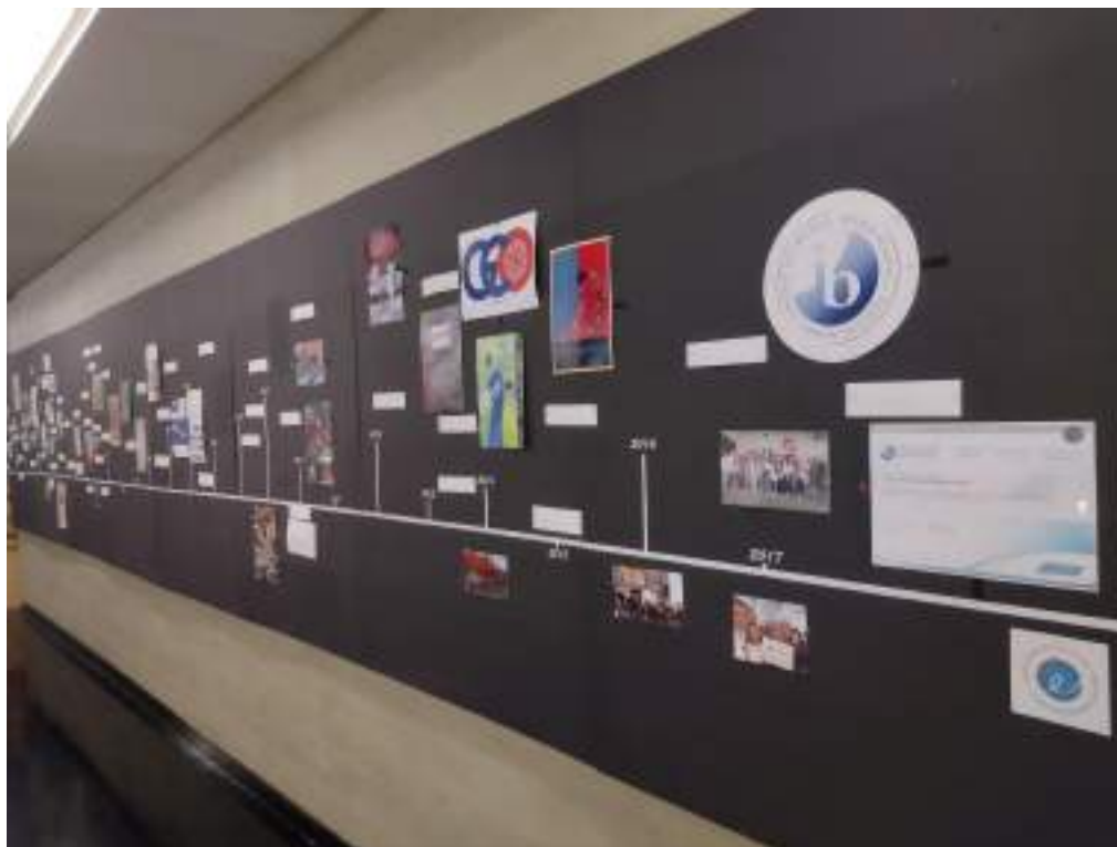
IB w szkole