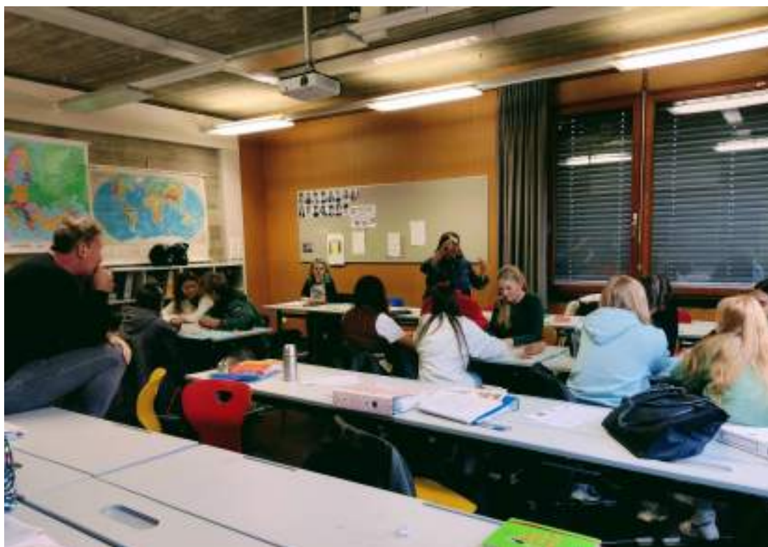
lekcja historii + j. hiszpańskiego