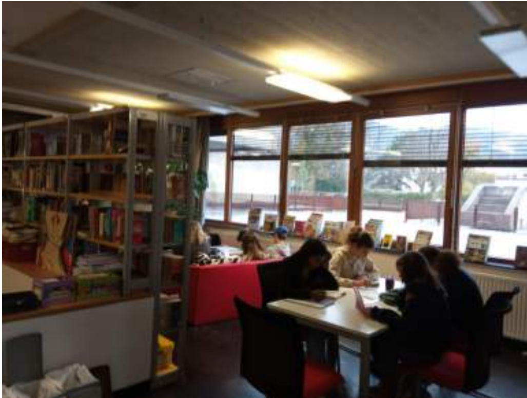
młodzież pracująca w bibliotece