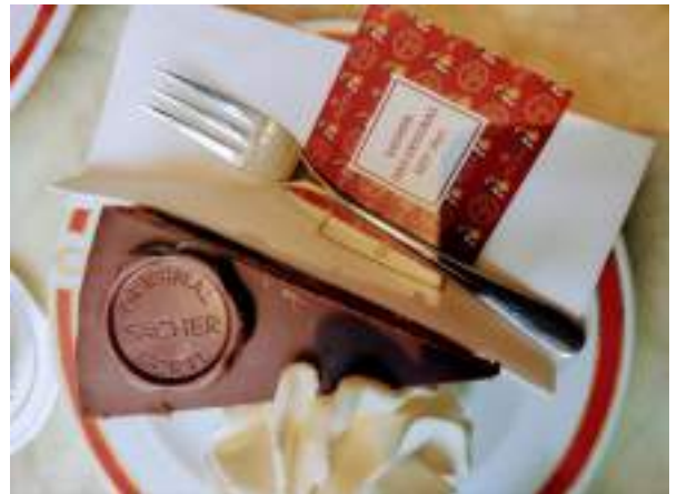
Tradycyjny austriacki tort Sachera