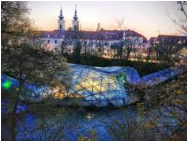
Rzeka Mur i restauracja w kształcie szklanej muszli na wyspie

Graz jest malowniczym miastem położonym nad rzeką Murą u podnóża zamkowego wzgórza Eggenberg. Miasto Graz oferuje turystom niezapomniane wrażenia - poprzez zabytki, z których starówka wpisana została na listę światowego dziedzictwa UNESCO, obcowanie z piękną przyrodą, tradycyjną austriacką kuchnię i ważne wydarzenia kulturalne. Jest również ważnym ośrodkiem uniwersyteckim, w granicach miasta znajdują się cztery uniwersytety. Poza zajęciami w szkole GIBS zwiedzaliśmy miasto Graz - mieliśmy okazję podziwiać znane miejsca jak ruiny zamku Schlossberg z dwiema wieżami, spośród których charakterystyczna wieża zegarowa jest symbolem miasta, renesansowy budynek starostwa Landhaus , nowoczesny budynek Kunsthau Graz gdzie znajduje się galeria sztuki. Spróbowaliśmy przysmaków kuchni lokalnej oraz zaznaliśmy życia kulturalnego będąc na koncercie światowej sławy gitarzysty.